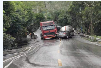
1、2019年7月22日瓮福委派的

我作为玖源公司旗下的一名销售人员，下设计划与危化品车辆的调配也是我其中的工作任务之一。平时除了与客户和驾驶员打交道的比较多。不管企业的生产还是客户所派的车辆出现安全事故，对于我们销售人员来说都是非常重要而紧急的。安全第一，这几乎是每个企业都在反复强调的事情，但是在实际工作中真正能落到实处的却不在多数。现就近期发生在我身边的几起安全事故举例说明：