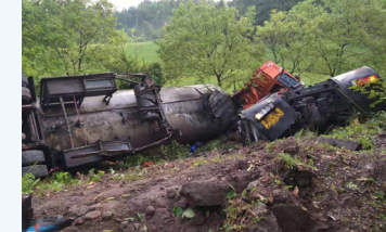
3、落实制度：落实制度是确保安全所在，只有坚持一点一滴抓才能富有成效，才能养成一种良好的习惯。

集团义马气化厂C套空气分离装置发生“砂爆”，这是一种空分冷箱发生漏液，保温层珠光砂内就会存有大量低温液体，当低温液体急剧蒸发时冷箱外壳被撑裂，气体夹带珠光砂大量喷出的现象，进而引发冷箱倒塌，导致附近500m3液氧贮槽破裂，大量液氧迅速外泄，周围可燃物在液氧或富氧条件下发生爆炸、燃烧，造成周边人员大量伤亡。事故共造成15人死亡、16人重伤、256人入院治疗。事故直接原因是空气分离装置冷箱泄漏未及时处理，企业却仍坚持“带病”生产，直至7月19日发生爆炸。